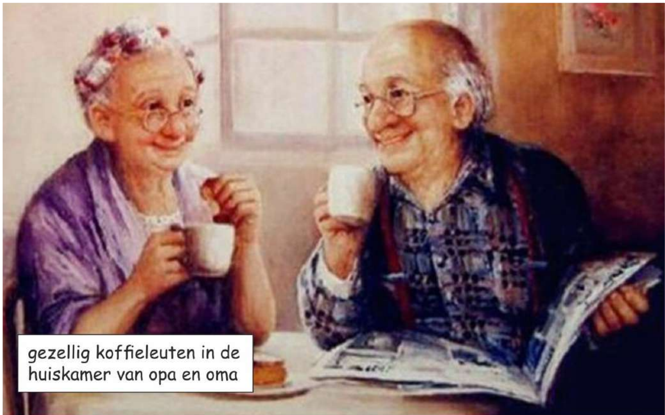
gezellig koffieleuten in de huiskamer van opa en oma

neringen staan ook de geuren van de toiletten van de basisschool, te lang gekookte bloemkool en wat te denken van de uitwerpselen van de gierkar van Toon de Rommel op het Papenland. Het zijn smerige luchtjes waar ik nooit van in extase ben geraakt.